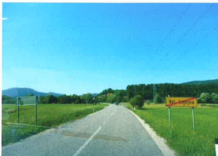
Slika 17: konec naselja Velika Ligojna