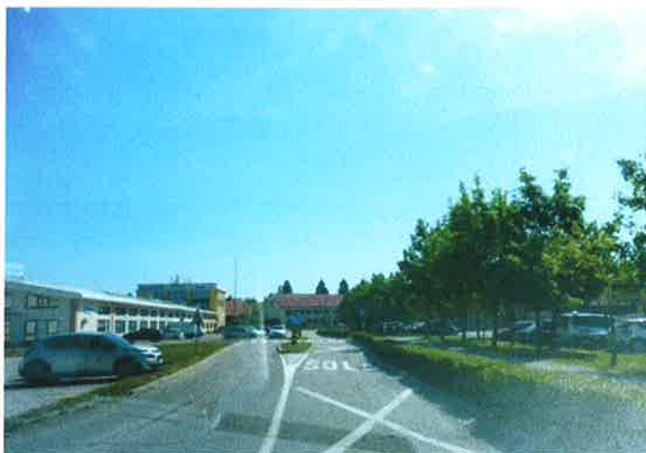
Slika 26: območje pri OŠ Antona Martina Slomška Vrhnika pododsek 4