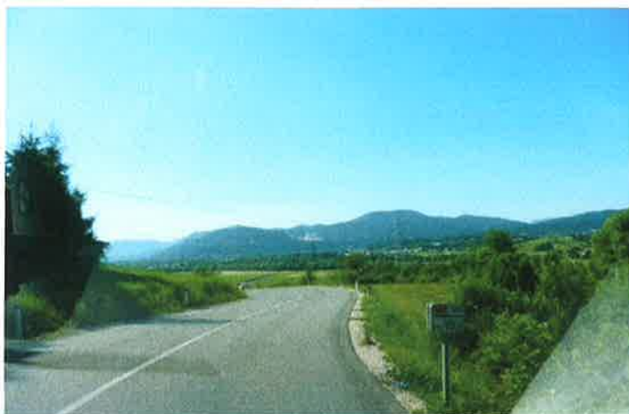
Slika 11: km 10,000, trasa pododseka 2