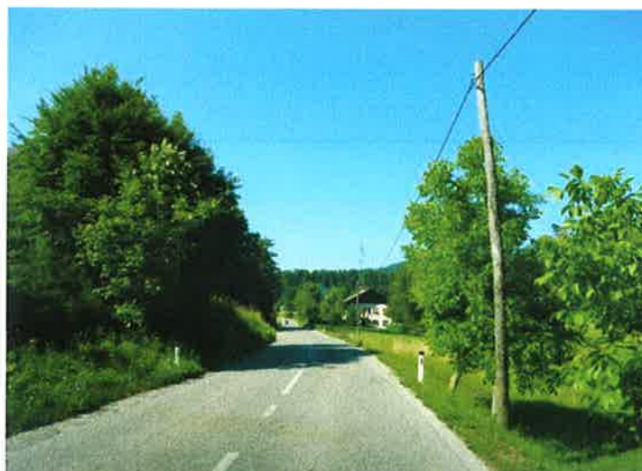
Slika 16: naselje Velika Ligojna pododsek 2