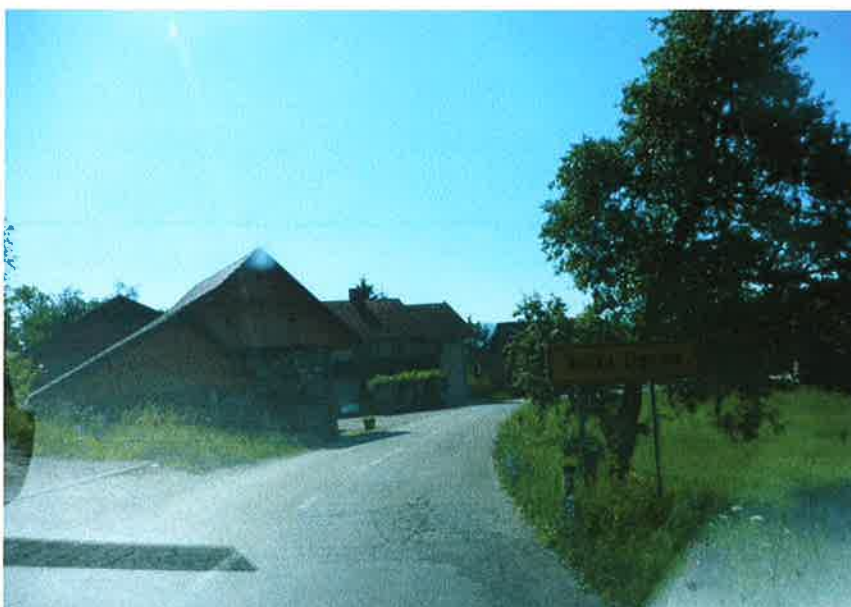
Slika 2: naselje Velika Ligojna, km 10,817

Izvedeno je utrjeno asfaltno vozišče širine 5,0 m z razširitvami do 6,4 m z obojestransko bankino oz. na določenih mestih asfaltno muldo. Vozišče in bankina sta v slabšem stanju. Omejitev hitrosti na odseku izven naselja je 40 km/h. Kolesarska infrastruktura na obravnavanem odseku ni izvedena, prav tako ni površin za pešce. Odvodnja meteorne vode je na odseku izven naselja preko enostranskega prečnega nagiba in vzdolžnega nagiba speljana v asfaltno mulde ter preko 4 prepustov razpršeno po terenu. V naselju je izvedena lokalna meteorna kanalizacija s cestnimi požiralniki. Na območju izven naselja ni javne razsvetljave. V naselju je nekaj svetilk javne razsvetljave.