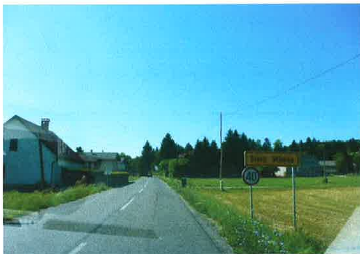
Slika 23: začetek naselja Stara Vrhnika pododsek 3