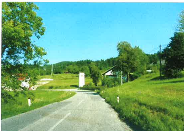
Slika 14: razpršena pozidava naselja Velika Ligojna pododsek 2