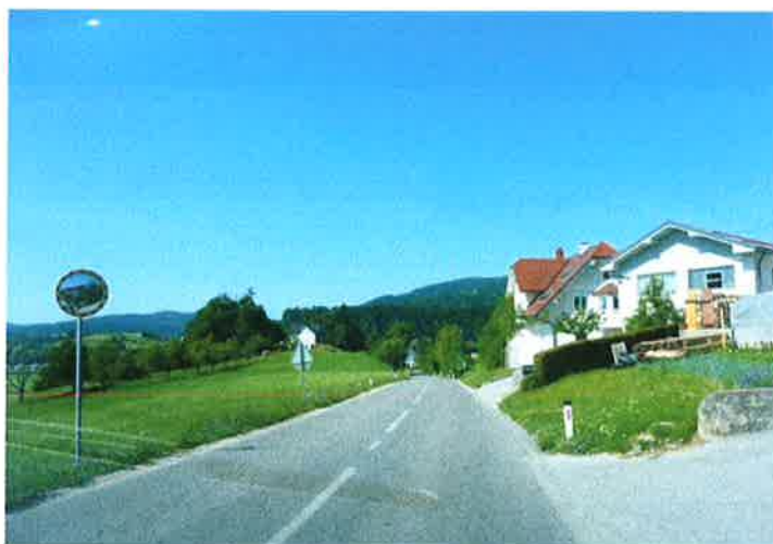
Slika 15: naselje Velika Ligojna pododsek 2