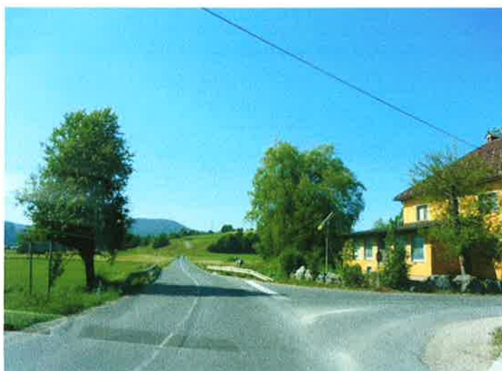
Slika 21: Priključek lokalne ceste (Rovte) pododsek 3