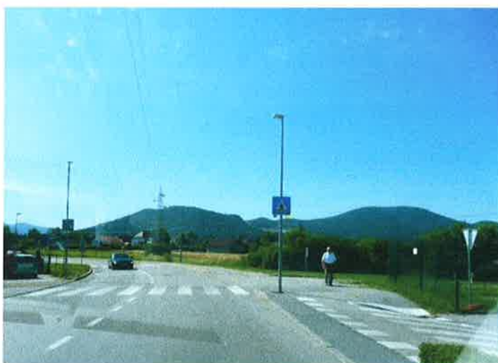
Slika 27: priključek na Ljubljansko cesto pododsek 4