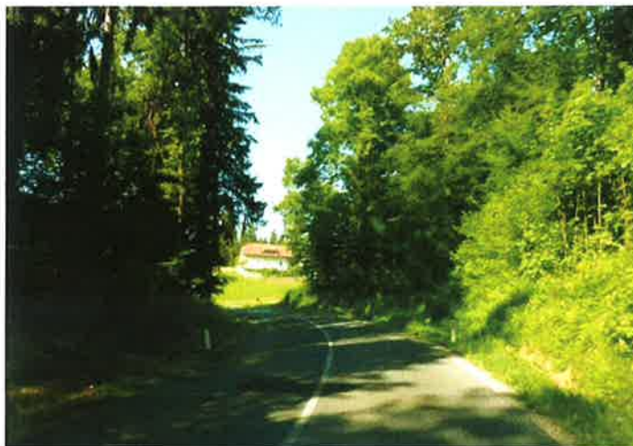
Slika 8: trasa pododseka 1