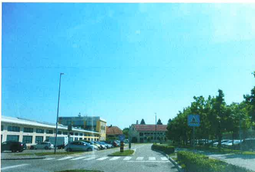
Slika 4: območje OŠ Antona Martina Slomška Vrhnika, LZ 466071

Trasa poteka ob Ljubljanski cesti od P+R Sinja Gorica do križišča z Opekarsko cesto. Poteka po DKP D1 ob regionalni cesti R2-409/0300. Ob Ljubljanski cesti je na večjem delu že obstoječa obojestranska kolesarska steza širine 1,6 m. Vzdolž celotnega odseka je urejena cestna razsvetljava.