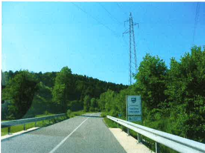
Slika 6: meja občine Vrhnika in občine Horjul, km 8,990 (meja obdelave)

Pododsek 1: meja občine Vrhnika z občino Horjul – do zaselka Razpotje (del naselja Velika Ligojna); R2-407/1145