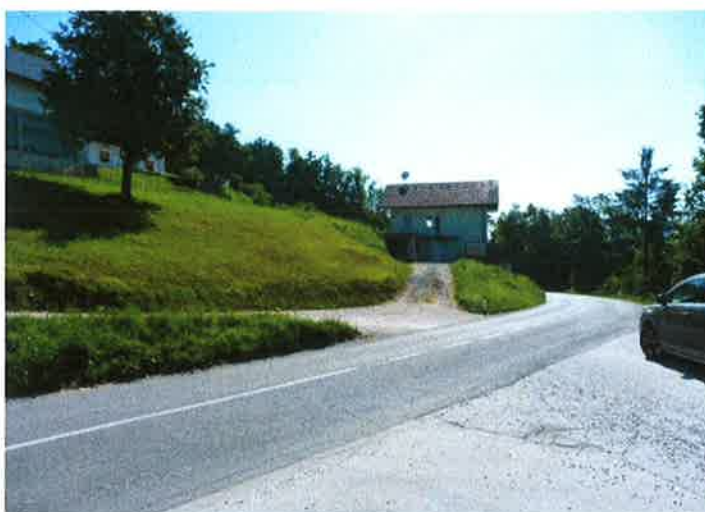
Slika 9: križišče Razpotje - trasa pododseka 1