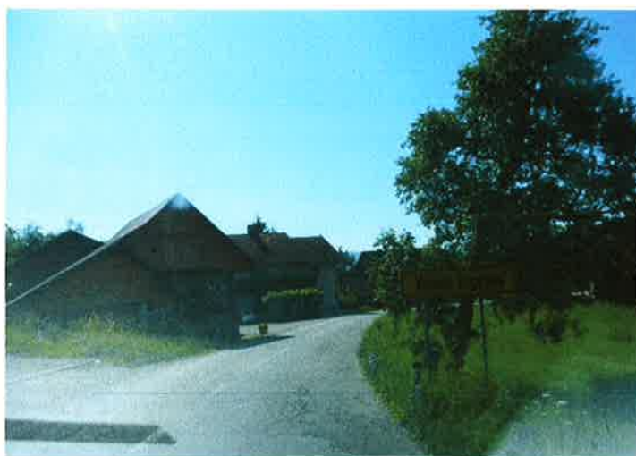
Slika 12: naselje Velika Ligojna