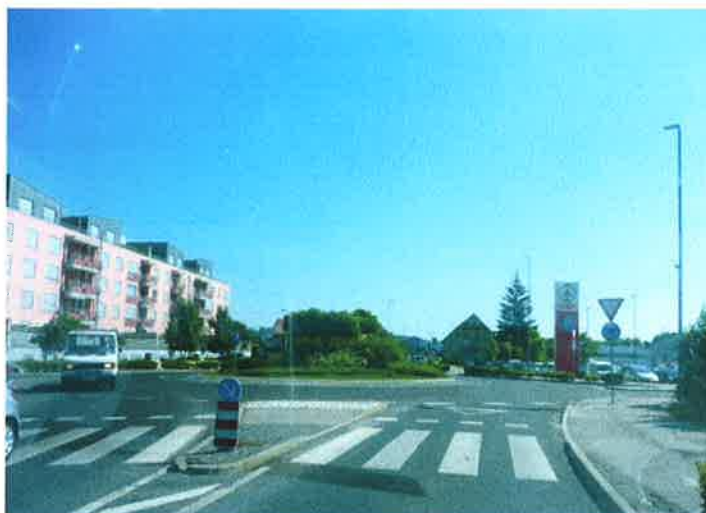
Slika 29: krožišče pri »Spar-u« Ljubljanska cesta pododsek 5