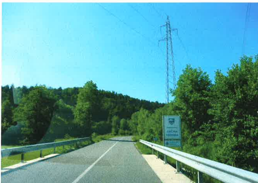
Slika 1: meja občine Vrhnika in občine Horjul, km 8,990