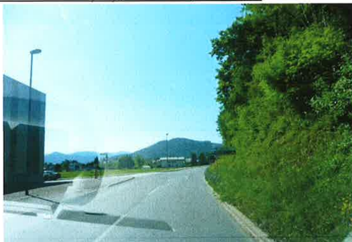
Slika 24: pododsek 4