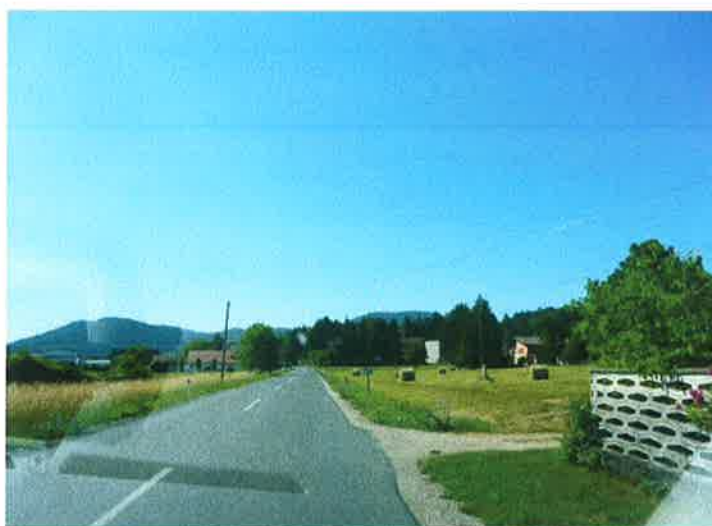
Slika 22: pododsek 3