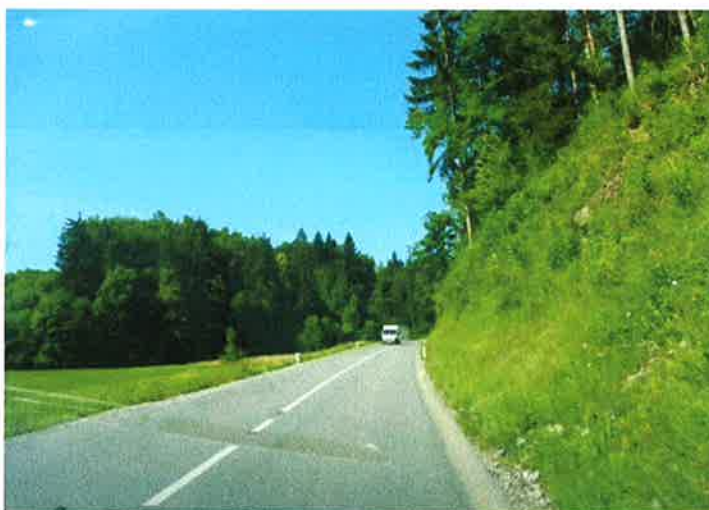
Slika 7: trasa pododseka 1