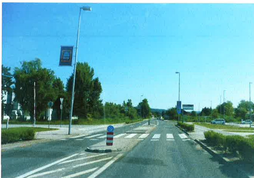
Slika 5: P+R, km 12,960 – R2-409/0300

Trasa poteka ob Ljubljanski cesti od P+R Sinja Gorica do križišča z Opekarsko cesto. Poteka po DKP D1 ob regionalni cesti R2-409/0300. Ob Ljubljanski cesti je na večjem delu že obstoječa obojestranska kolesarska steza širine 1,6 m. Vzdolž celotnega odseka je urejena cestna razsvetljava.