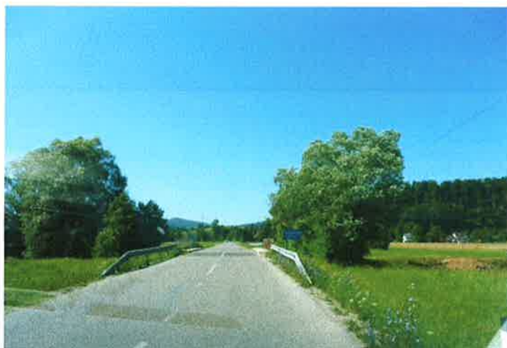
Slika 19: Most čez Podlipščico pododsek 3