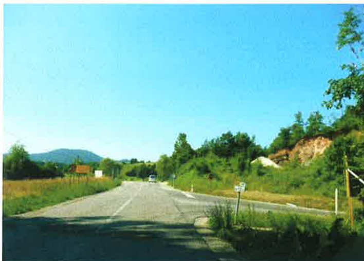
Slika 20: Priključek lokalne ceste (Podlipa) pododsek 3