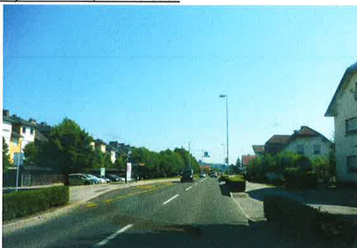
Slika 28: Ljubljanska cesta pododsek 5