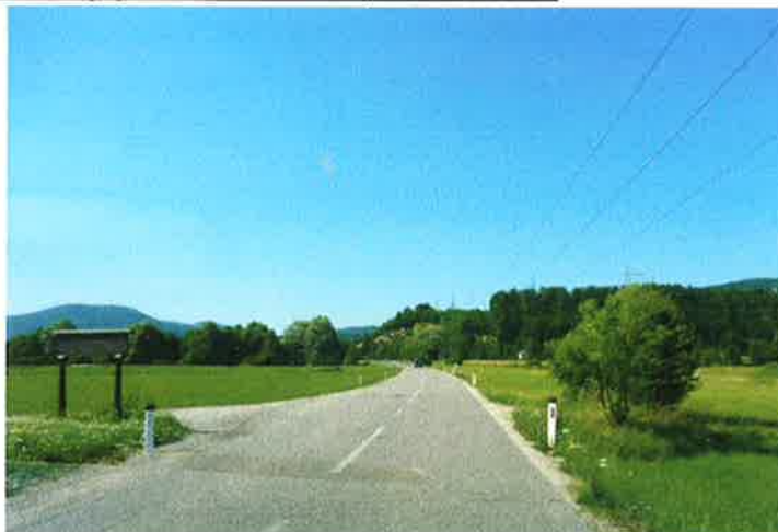
Slika 18: pododsek 3