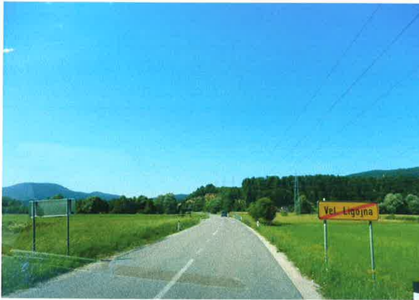
Slika 3: konec naselja Velika Ligojna, km 11,864

Regionalna cesta na obravnavnem odseku prečka Podlipščico in Lahovko ter nekaj manjših strug vodnega toka. Ob cestnem svetu je na manjšem delu melioracijski jarek.