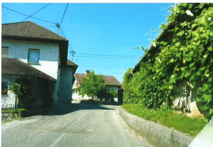
Slika 13: strnjena pozidava naselja Velika Ligojna pododsek 2