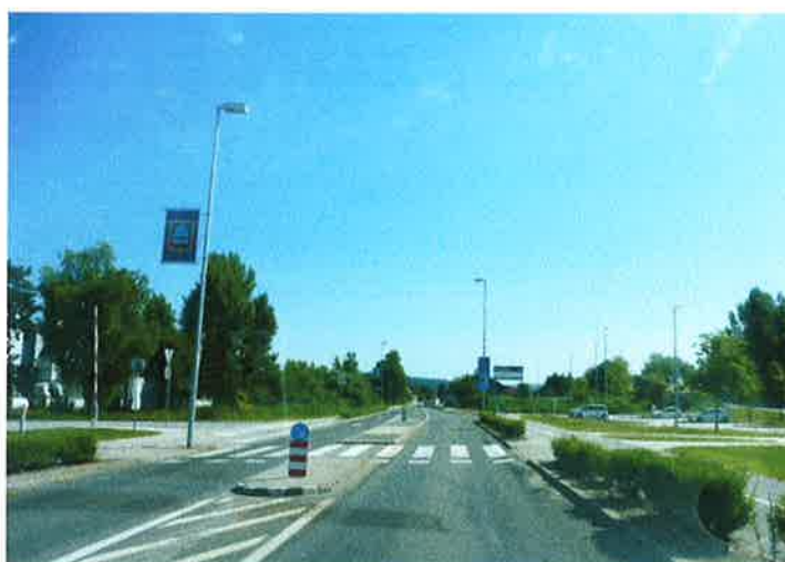
Slika 30: navezava na P+R Ljubljanska cesta pododsek 5