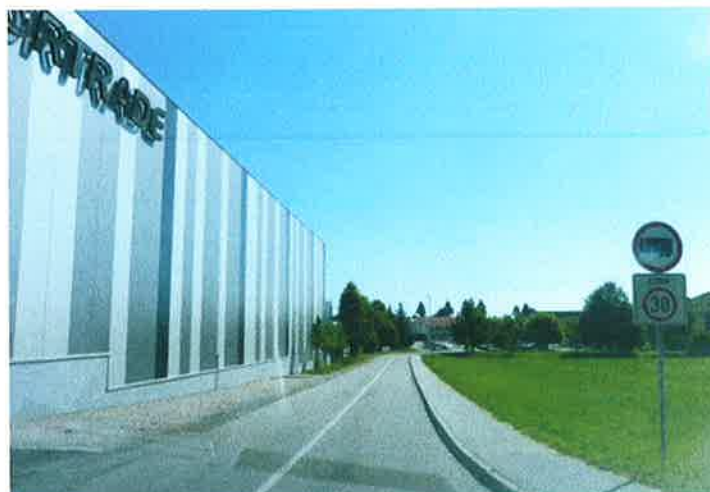
Slika 25: pododsek 4